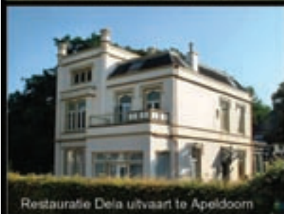
Restauratie Delta uitvaart te Apeldoorn

Ervaring in nieuwbouw verbouw restauratie