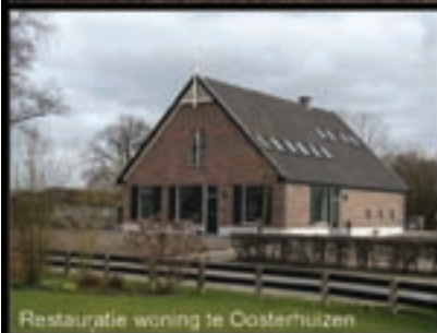
Restauratie woning te Oosterhuizen