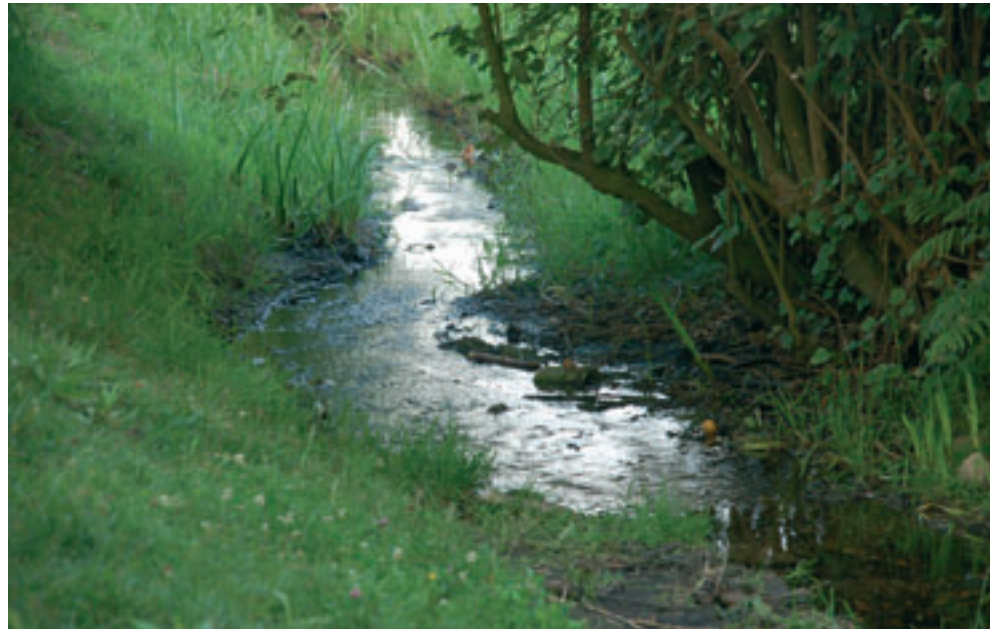
In de bossen en door de tuinen van Paleis het Loo stroomt de Koningsbeek richting de rioolwaterzuivering. Deze beek zal gerenoveerd worden.

De Koningsbeek moet het karakter krijgen van een landelijke beek. Dat betekent dat de beekzone minimaal vijftig meter breed