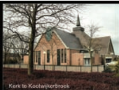
Kerk te Kootwijkerbroek